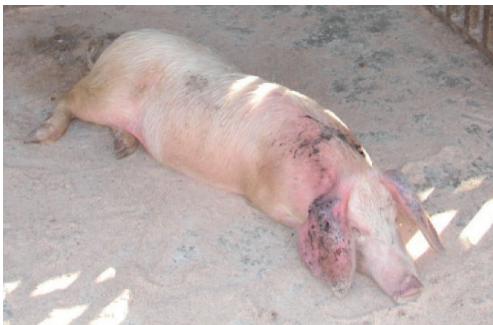
Ein an ASP erkranktes Hausschwein

Das Bundesministerium für Gesundheit ersucht TierärztInnen, TierhalterInnen und die Jägerschaft um erhöhte Aufmerksamkeit und Sorgfalt, um eine Einschleppung der ASP nach Österreich zu verhindern und allfällige Ausbrüche so früh als möglich festzustellen!